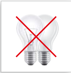
Gloeilampen E27 lampvoet

Welke energiebesparende lamp is het meest geschikte alternatief **