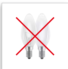
Kaarslampen E14 en E27 lampvoet

Welke energiebesparende lamp is het meest geschikte alternatief **