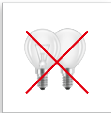
Kogellampen E14 en E27 lampvoet

Welke energiebesparende lamp is het meest geschikte alternatief **